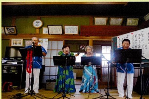
ウクレレアロハーズ

地域のサロンからもボランティア団体の演奏や発表は大人気で、鑑賞されている方々は歓声をあげたり拍手を送ったりと楽しまれていました。