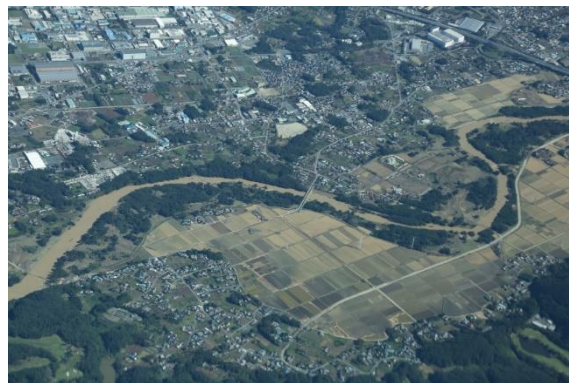
令和元年10月13日撮影 都幾川 神戸大橋付近