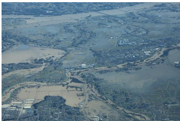
令和元年10月13日撮影 左下が高坂ピオニウオーク付近