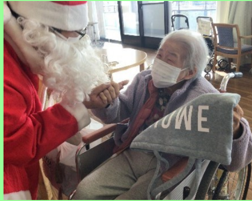
プレゼントありがとう！