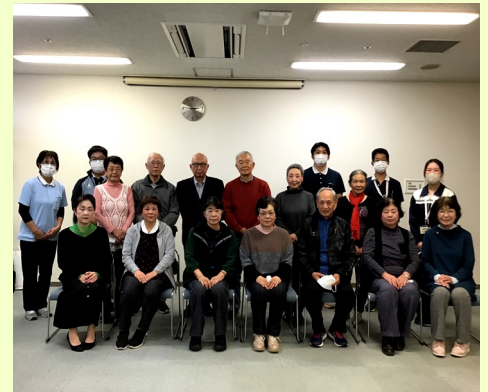
最後に職員とボランティアの方々とで記念撮影をしました。