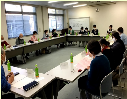
活発な意見交換が行われました。

感染症流行の影響などにより、4年ぶりの開催となったこの集いですが、ボランティア活動の大変さや、やりがい、他のグループに聞いてみたいことなど、活発な意見交換が行われました。和やかな雰囲気の中、沢山の意見をうかがうことができました。また、職員からの感謝の言葉もお伝えすることができました。今後もボランティアの方々にとってより活動しやすい環境を整えていきますので、ご協力のほどよろしくお願いいたします。