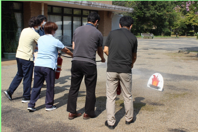
エリアでの消火訓練の様子

また、9月～10月にかけて、ケア・サポートいわはな・グループホームかがやき・共生型多機能センターあすみーるの各施設においても、同様に日中想定 of 防災訓練を行いました。これからも防災の意識を持ちながら、日々の業務に取り組んでまいります。