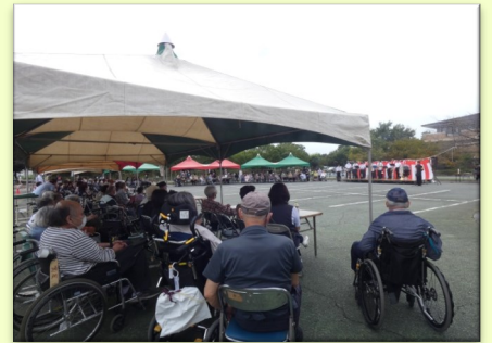
たくさんのご利用者やご家族が参加されました