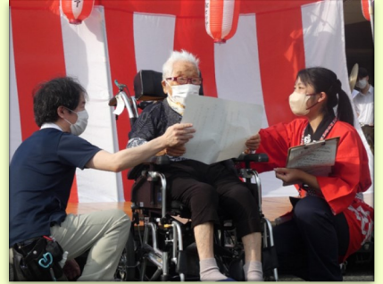
ご利用者代表あいさつ