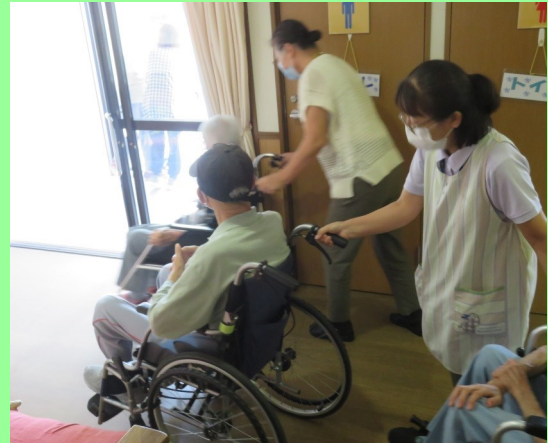
あすみーるでの避難訓練の様子