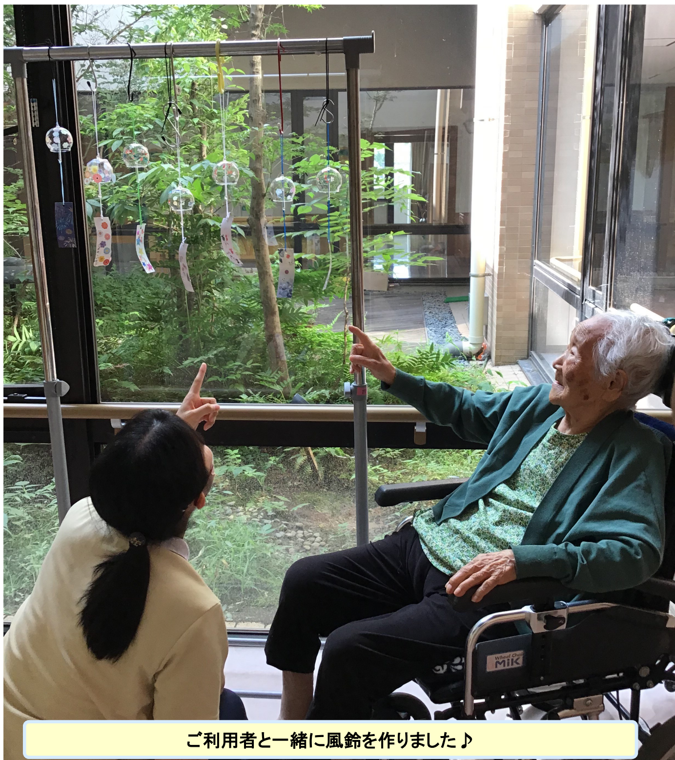
ご利用者と一緒に風鈴を作りました♪