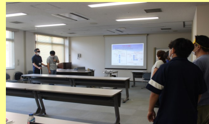
座学や演習を受けている様子です