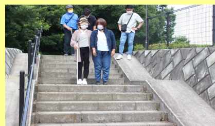
車や階段での声掛け、誘導方法を学びました