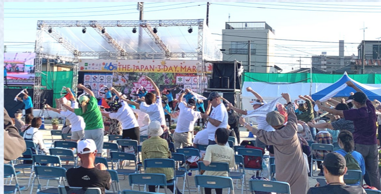
会場の方も元気にハッピー体操をしています(^_^)