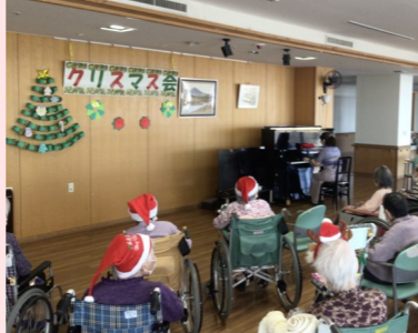
素敵な演奏にうっとり♪