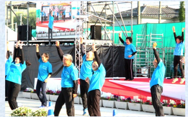
サポーターも元気にハッピー体操を披露しています☆

介護予防事業では、11月3日(金)スリーデーマーチに参加し、ハッピー体操を披露しました。