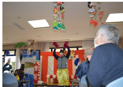
マツケンサンバで大笑い