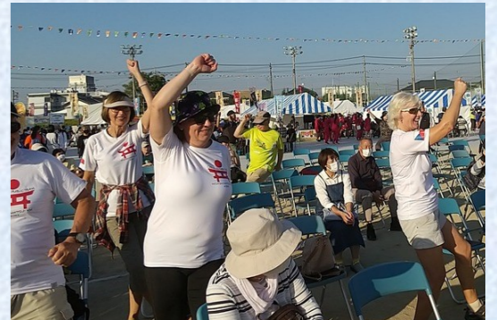
海外からの方もハッピー体操に参加されました♪