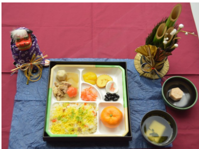
お正月の特別料理

職員一同、ご利用者の方々と笑顔でお正月を迎えることができ、よい新年の幕開けとなりました。本年もよろしくお願いいたします。