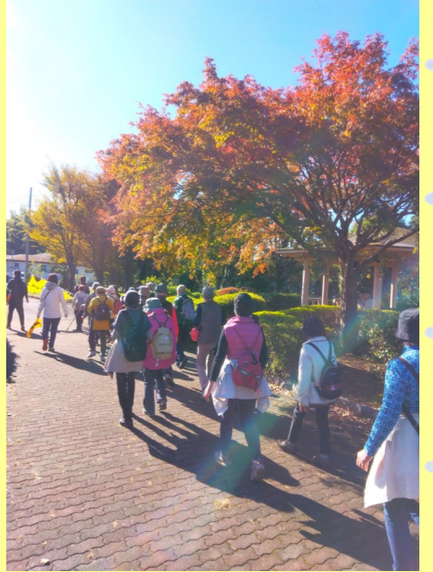
秋晴れの中、紅葉を楽しみながら、ウォーキングが出来ました☆