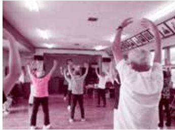
つどい市ノ川サロン