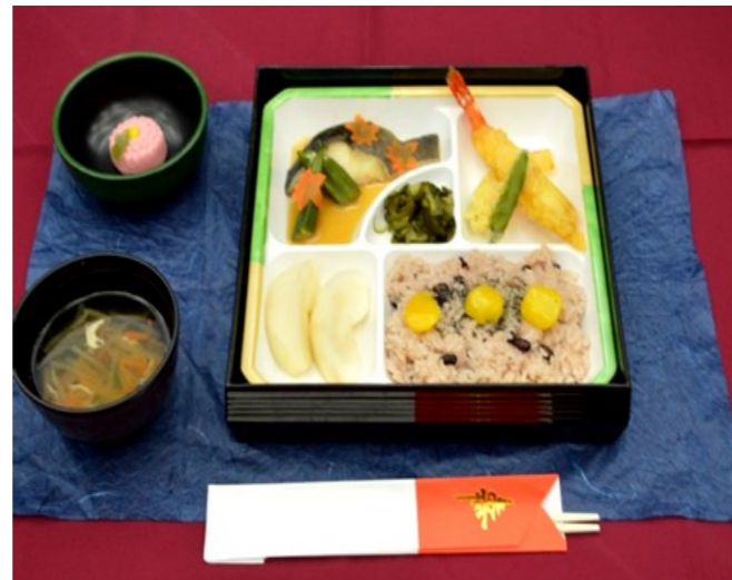
大好評だった敬老会メニュー