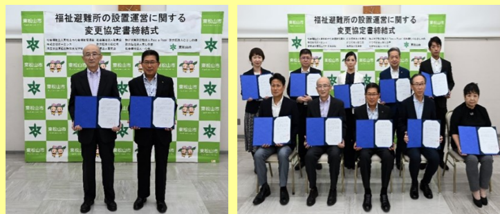
東松山市内10か所の福祉避難所が調印を行いました。