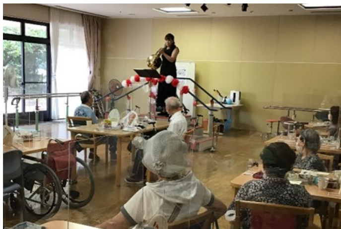
トランペット・ホルンの演奏

ケアサービス課では9月20日(水)に敬老会を開催しました。感染症予防のため通所、入所2階、入所3階と分かれて表彰式、イベントを実施しました。ボランティアの方や職員によるトランペット、ホルン、オカリナ、ピアノ楽器演奏が披露され、美しい音色に皆さん聴き入っていました。記念品の授与も行われ、総合福祉エリアのキャラクターであるコアアがデザインされたタオルをお渡しし、ご利用者からは「良い記念になったよ、ありがとう。」とご好評のお言葉をいただきました。敬老会の豪華な行事食も提供されました。皆様と共に長寿をお祝いすることができ、笑顔溢れる幸せなひと時となりました♪