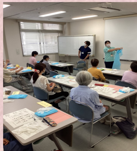
職員による着脱方法の説明

総合福祉エリアヘルパーステーションでは、9月に約90名の職員・登録ヘルパーを対象に、感染症対策についての訓練を行いました。今回は適切なサービス提供に繋がられるよう、ガウンの着脱方法について理解を深める学習、シミュレーションを行いました。