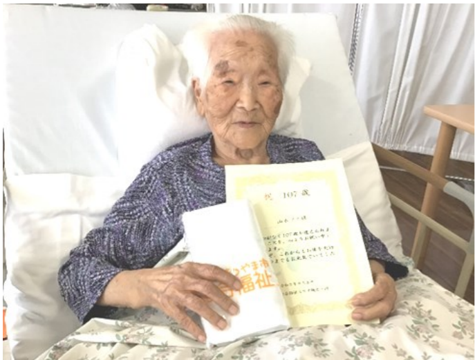
当施設最高齢107歳の方に表彰状をお渡ししました！