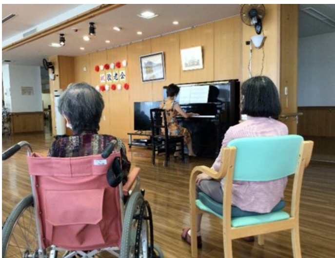
ピアノの音色に皆さん聴き入っています♪