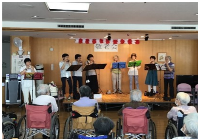
ボランティアによるオカリナ演奏