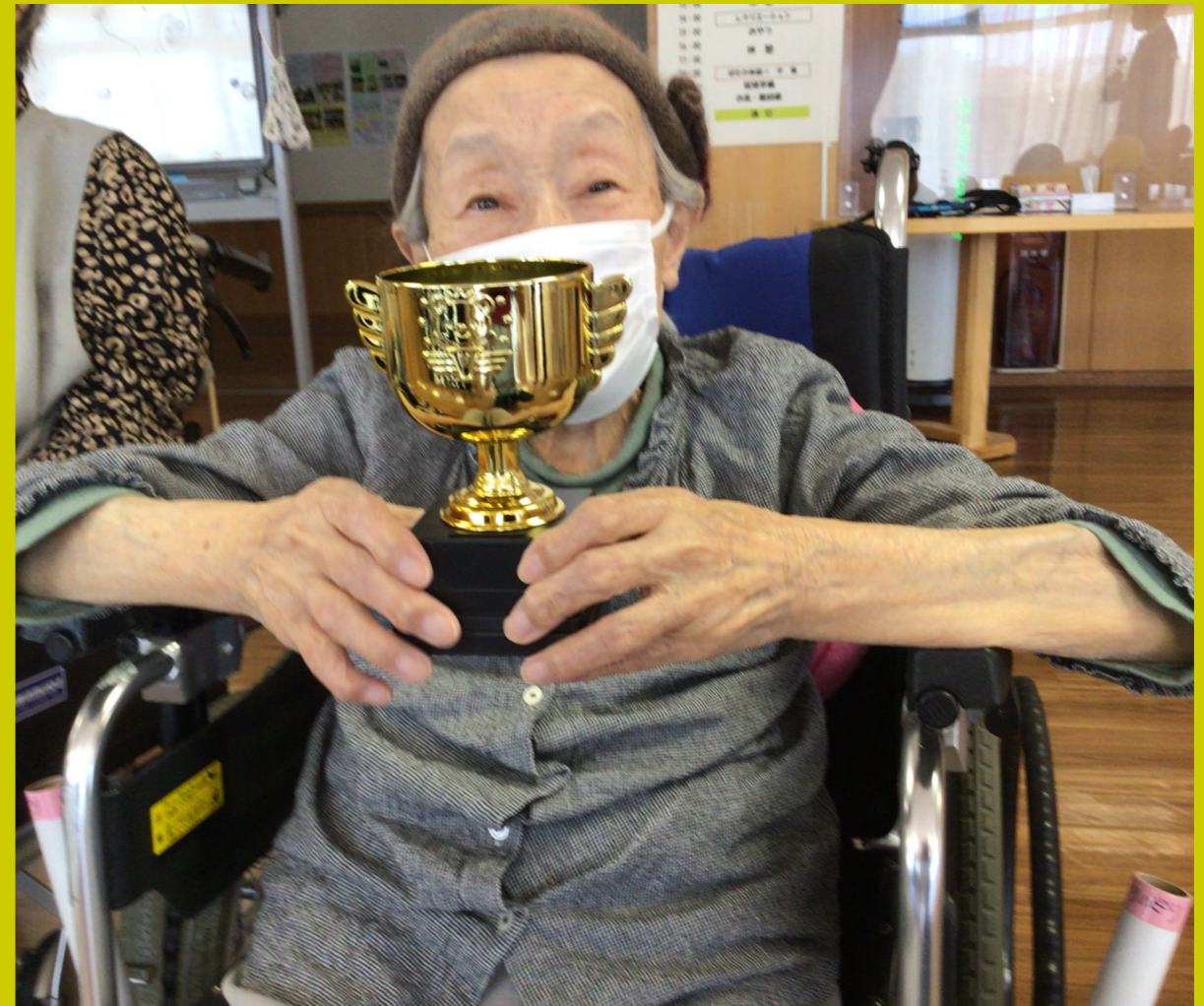
ケアサービス課: 入所フロアで10月に運動会を開催しました!