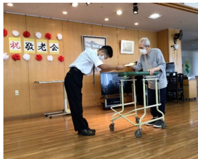
喜寿・傘寿・米寿など節目を迎えた方へ表彰状です