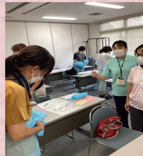
ガウンの着脱訓練