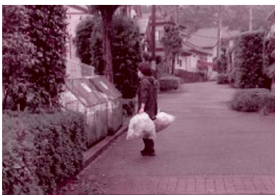
支え合いサポート事業では、お部屋の掃除、買い物支援、ゴミ出し、外出支援などを地域の有償ボランティアさんがお手伝いしています。ボランティアさんは、「できる時に、できる事を、できる範囲で」を合言葉に活動しています。

生活支援コーディネーターは、 サロンなどに訪問し地域の「お宝」を探したり、 地域の課題について一緒に考えたり、 必要としている人(ところ)に地域の資源を つなげるお手伝いをしています。 身近な「お宝」ぜひ教えてください!