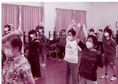
サロンで体操やお話しをして楽しんでいます。学生ボランティアも参加しています。〔サロン活動〕