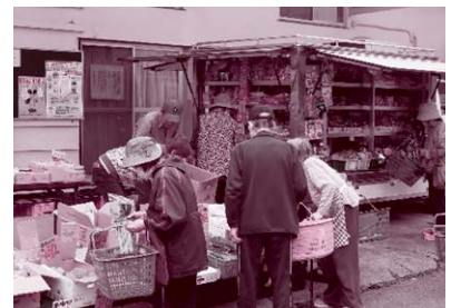
自分の目で見て買い物ができる移動販売の取り組みを進めています。 〔平野地区「結」を広げ隊 ひらのん〕