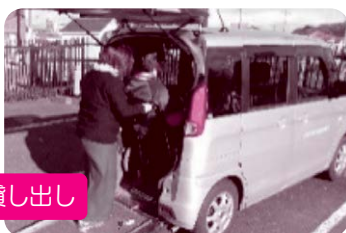
福祉車両の貸し出し