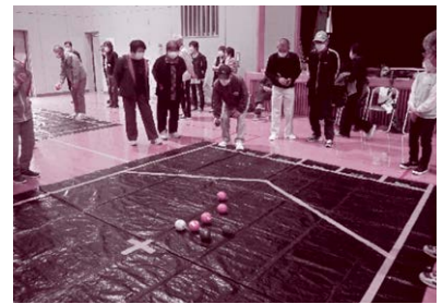
ボッチャを通じて楽しく地区内の交流を深めています。 〔唐子地区 ひと声かけ隊〕