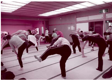
大東文化大学相撲部と連携した健康講座と交流会を開催。世代間交流のきっかけにもなりました。 〔高坂丘陵地区 丘陵ささえ愛♡〕

東松山市での地域活動や地域資源を地域の「お宝」と称して、その一部をご紹介します。他にもたくさんの「お宝」があります。みなさんの「できる!」「やりたい!」を「お宝」として活かして、地域で活動してみませんか?