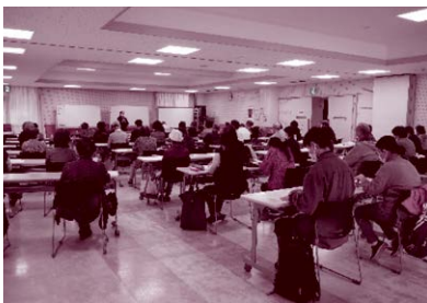
生活支援ボランティア養成講座を開催。ボランティア活動の初め的一步や、ボランティア活動のスキルアップにつなげています。