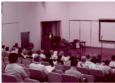
各地区での地域課題についての話し合い・取り組みの報告会を行いました。他地区での取り組みを知る機会となりました。〔第2層協議体報告会〕