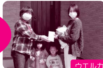
ウエルカムベビー