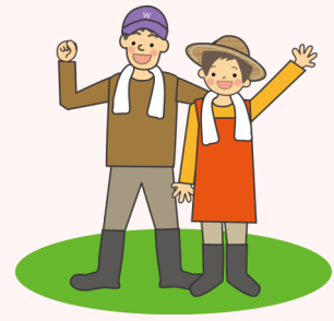
草むしりや 庭の手入れ