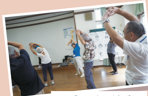
四季の丘いどばた