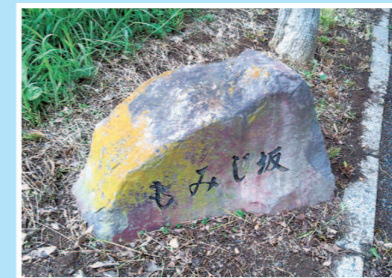
もみじ坂のもみじ