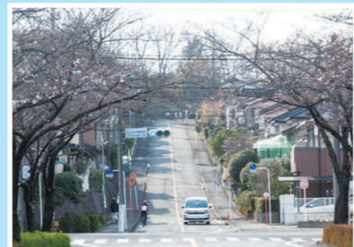
下から見ると急な坂であることがわかります