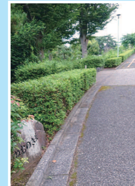
千年谷公園と住宅の間を山の辺橋に向かう遊歩道