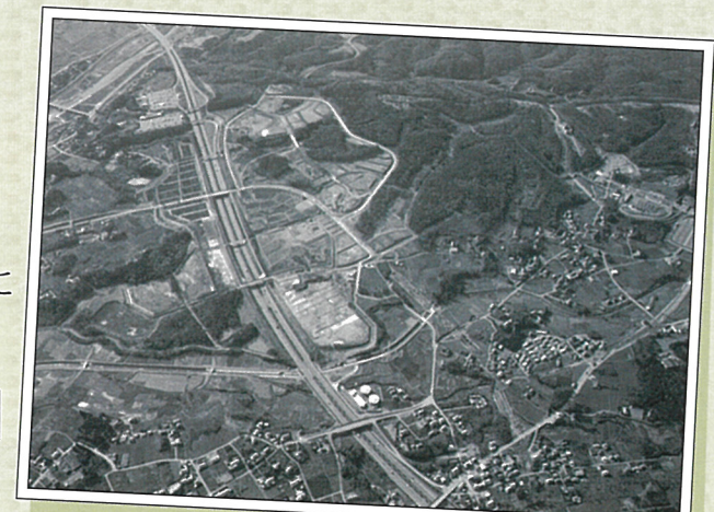
▲高坂ニュータウン造成工事全体の写真