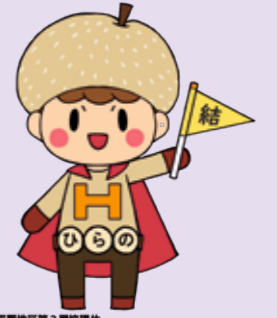
平野地区第2地区協議体「結(ゆい)」を広げ隊ひらのんキャラクター